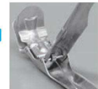
※コイルバネ式です。