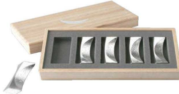
②能作 錫 箸置 「月」5ヶ入