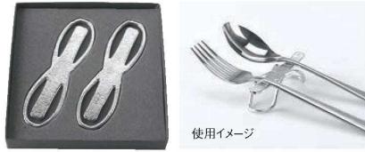
①能作 錫 カトラリーレスト ハーチ 2ヶ入