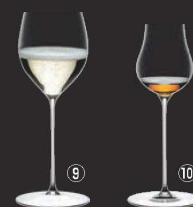
⑨ シャンパーニュ・ワイン・グラス 0425/28 (6個入) 切