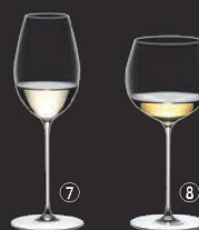
⑦ ソーヴィニヨン・ブラン 0425/33 (6個入) 切