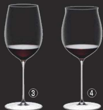
③ ボルドー・グラン・クリュ 0425/00 (6個入) 切

より大きく、より軽く、より薄く 最新技術の粋を集めた、リーデルマシンメイドグラスの決定版