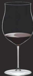
② ブルゴーニュ・グラン・クリュ 0300/16 (6個入) 切