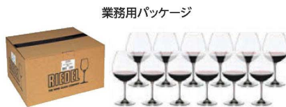
業務用に簡素化した、段ボール仕様のパッケージで納品いたします。