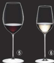
⑤ シラー 0425/41 (6個入) 切