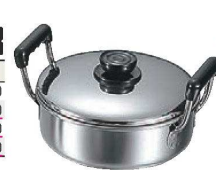
⑨MA 18-0 浅型 ソースポット