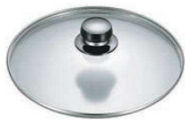
⑤エレックマスターライト用 ガラス蓋