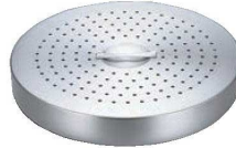
⑥スチームプレート