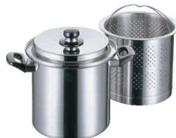
④バスケットポット

蓋と本体がピタリと合う精巧な造りで完璧にウォーターシールされ、ビタミンやミネラルの流出も少なく、無水・無油調理に抜群の効果を発揮します。