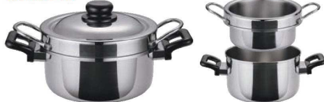
⑤ ニューグッドベンリー 余熱調理鍋