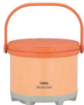
④ サーマス 真空保温調理器 シャトルシェフ