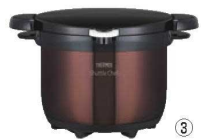
③ サーマス 真空保温調理器 シャトルシェフ CBW (クリアブラウン)