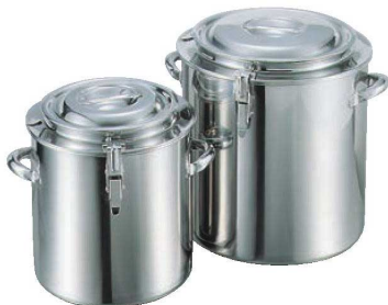
⑦ EBM 18-8 湯煎鍋