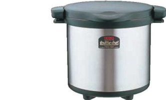
① サーマス 真空保温調理器 シャトルシェフ