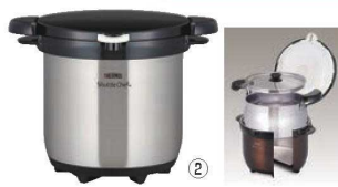
② サーマス 真空保温調理器 シャトルシェフ CS (クリアステンレス)