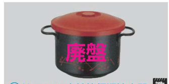
⑥ サーマス 高性能保温汁容器 シャトルスープ KAE カエデ