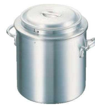
⑧ アルミ 湯煎鍋