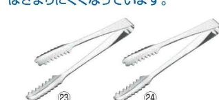
㉓ エコクリーン 18-8 ロール式厚口 棒型アイストング