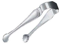
① EBM 18-8 セシリア アイストング