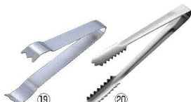
⑲ ステンレス Cr-3 アイストング

刃元と刃先にRがあるため、 従来品に比べ食材がささったり、 はさまりにくくなっています。