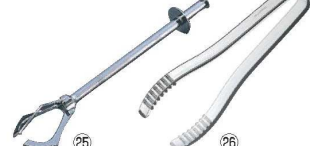
㉕ ヴォストフ アイストング 3566