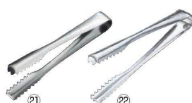
㉑ エコクリーン 18-0 棒型アイストング