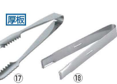
⑰ 18-0 棒型アイストング