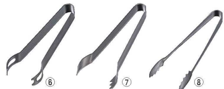
SW 18-0 アイストング