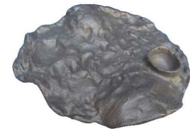
⑪月面プレート 黒砂 HO-358 洗