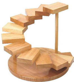
③螺旋(十二段) 35396 加 画A