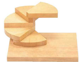
⑥回旋・角ベース(五段) 35399 加 画A