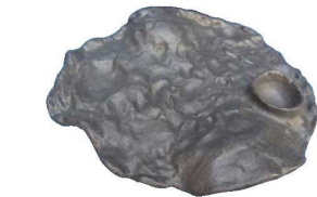
⑪月面プレート 黒砂 HO-358 洗