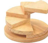
⑤回旋・丸ベース(六段) 35398 加 画A