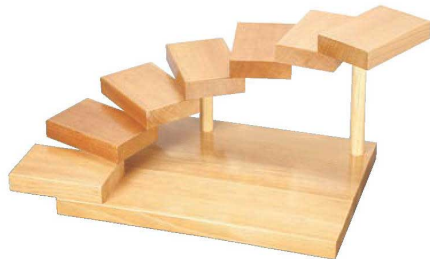
①段々(七段) 32360 加 画A