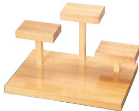
②遊山(三山) 32361 加 画A