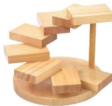
④螺旋(八段) 35397 加 画A