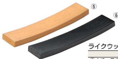
ライクウッド ハーフR