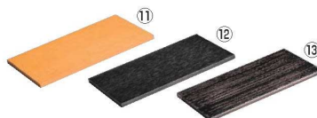
ライクウッド長角プレート