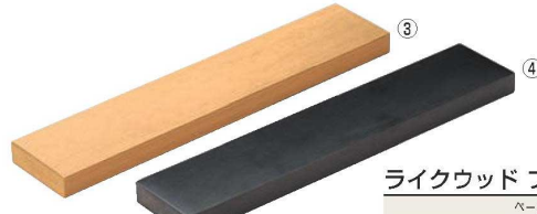
ライクウッド フラット