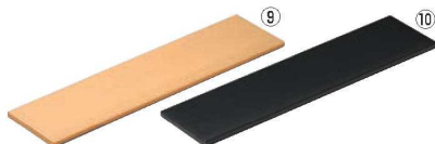
ライクウッド細長角プレート