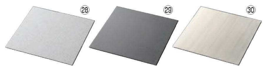
スクウェアプレートL