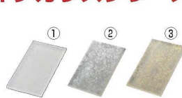
スリムレクタングルプレートM