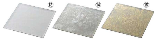
スクウェアプレートL