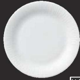
①クーププレート 27.5cm 1708L/90020 洗 ページコード 商品コード 価格 4-1610-0101 2125700 ¥1,750 φ274×H26