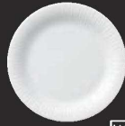
②クーププレート 24cm 1708L/90016 洗 ページコード 商品コード 価格 4-1610-0201 2125710 ¥1,400 φ239×H24