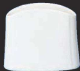
⑬ナフキンスタンド M200R/NB 洗 ページコード 商品コード 価格 4-1610-1301 4616800 ¥4,200 126×51×H107