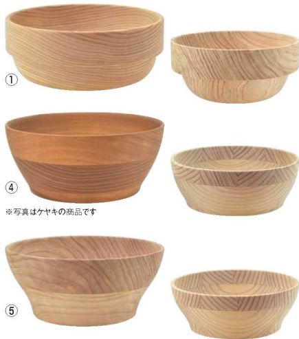
*写真はケヤキの商品です