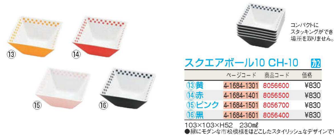
スクエアボール10 CH-10 切