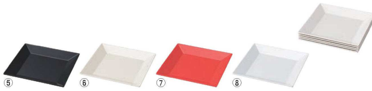
スクエアプレート SP-11 切 ⑤黒 ⑥マール ⑦赤 ⑧白 価格 144×144×H17 4-1684-0501 4-1684-0601 4-1684-0701 4-1684-0801 ¥1,190 1557180 1557190 1557200 1557210