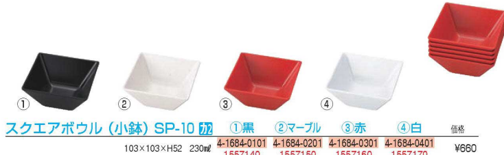
スクエアボウル (小鉢) SP-10 切 ①黒 ②マール ③赤 ④白 価格 103×103×H52 230ml 4-1684-0101 4-1684-0201 4-1684-0301 4-1684-0401 ¥660 1557140 1557150 1557160 1557170