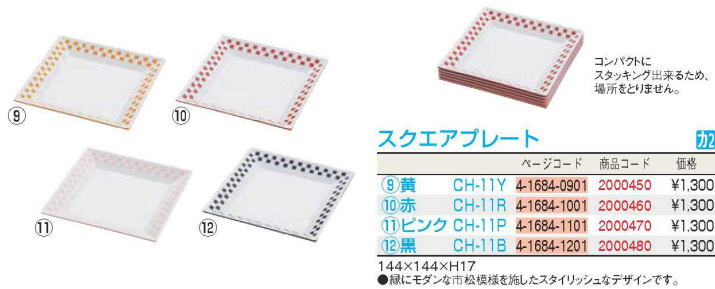
スクエアプレート 切