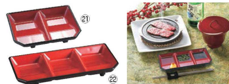
タレ皿 朱天黒 洗 納期 画A

●タレ入が斜めに設計されており、一般的なタレ入れに比べ少量で使用でき、経済的です。又、この部分で食材のタレ切もできるので大変便利です。 ●スタッキングOK