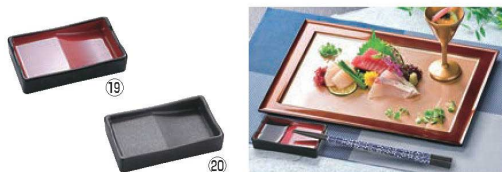
ABS 箸置付長角醤油皿 納期 画A