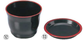
⑫まゆ型 千代口 黒天朱