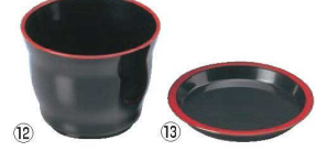
⑫まゆ型 千代口 黒天朱