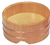
③さわら うどん桶 切