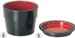
⑧黒太 千代口 黒内朱