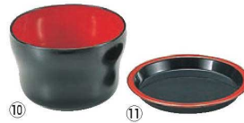
⑩ヒサゴ 千代口 黒内朱