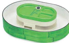
㉑家庭用流しそーめん竹取物語 16343 切