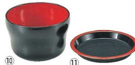
⑩ヒサゴ 千代口 黒内朱