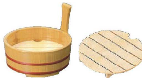
④白木片手盛桶 6寸 (目皿無) 画A