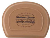
ライトブラウン 蓋