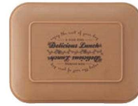
ライトブラウン 蓋