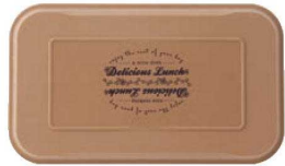
ライトブラウン 蓋