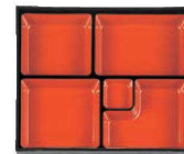
⑧長手布目 松花堂尺1寸用 5ツ仕切 朱天黒