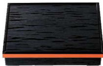
⑥長手へぎ目 松花堂 (仕切別) 黒淵朱 尺1寸