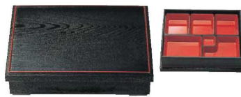
⑨木目 松花堂セット 黒天朱