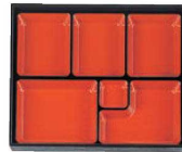
⑦長手へぎ目 松花堂尺1寸用 6ツ仕切 朱天黒