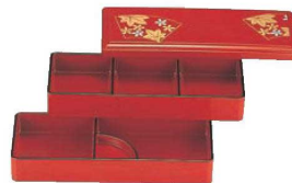
⑩立山弁当 二段 朱春秋