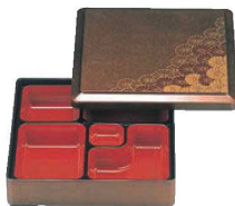
⑪DX 角弁当 梨地野菊 8寸