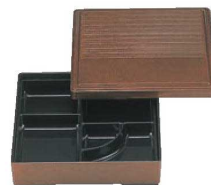
⑫角千筋弁当 梨地 8寸