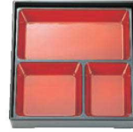
⑤トンカツ 朱天黒 8.5寸