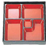
④DX幕ノ内 朱天黒 8.5寸