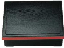
①木目 松花堂弁当 (仕切別) 黒淵朱 8.5寸