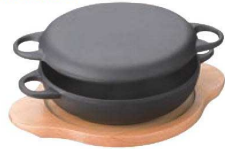
⑩鉄 ニューラウンド万能鍋 (木台付)