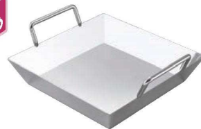
②EBM 18-0 深型 もつ鍋 (てっちゃん鍋)