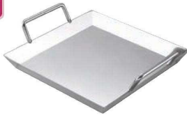
①EBM 18-0 浅型 もつ鍋 (てっちゃん鍋)