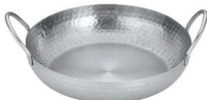
⑤UK ステンレス もつ鍋 ツチ目入