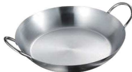
⑥AG ステンレス もつ鍋

板厚:18cm~20cm/1.0mm 24cm~28cm/1.2mm 材質:ST.ST