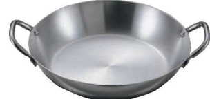
⑦18-0 丸もつ鍋 (万能鍋)