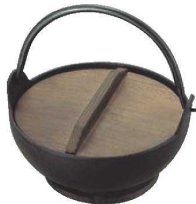
④トキワ 鉄 やまが鍋 413 切