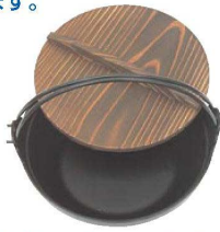
②南部 鉄 黒塗り ふる里鍋 切