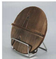
⑧EBM 18-8 なべ蓋スタンド 切