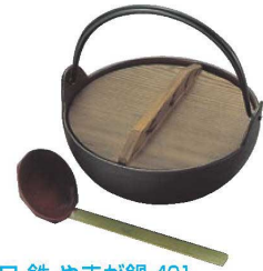
③トキワ 鉄 やまが鍋 401 切