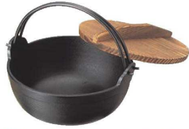
①南部 鉄 黒塗り ふる里鍋 深型 切

鍋は日本人のこころの故郷。鉄器が醸し出すやさしい風合いは、 人のぬくもりにも似て宴をいっそうあたたかなものにします。