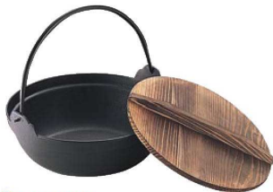
⑥IK S鉄鍋 切