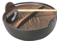
⑦五進 鉄 田舎鍋 切

※16~18cmは、電磁調理器にご使用できません。 ●内面加工がされていない為、鉄分の補給に最適です。