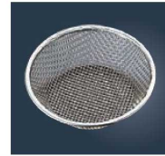
⑬ EBM 18-8 紙鍋ホルダー