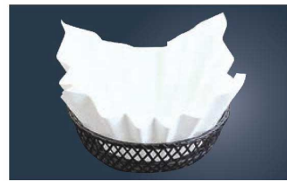
⑧ 紙すき鍋 春書 (300枚入)