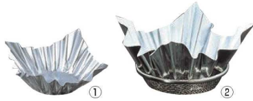
アルミ すき鍋 銀 (100枚入)

このページの紙すき鍋には ⑬ 紙鍋ホルダー 4-1754-1301 1685400 ¥920 をご使用ください。