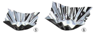
アルミ箔鍋 銀 (200枚入)