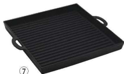
⑦アサヒ 鉄 角型グリルプレート 波