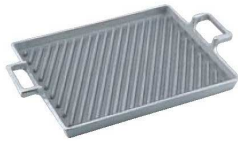
①アルミイモノ 角型 斜溝付 ステーキパン