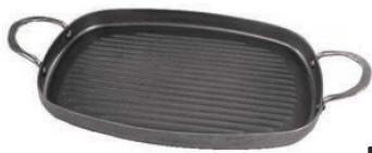
④デバイヤー 鉄 両手グリルパン