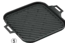
⑤トキワ ステーキグリル