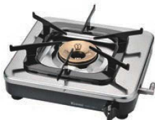
③リンナイ業務用ガスコンロ RSB-150PJ 画A