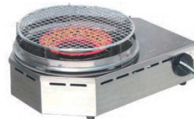
⑦コンパクト焼物コンロ KSR-NK 画A