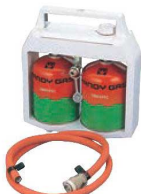
⑧簡易 ガス供給機 サファイヤー(H) (ボンベ2本付)