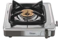
②パロマ ガステーブル PA-E18S (一口ステンレスタイプ) 画A