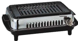
⑥シルクルーム 高級 焼肉器 じゅん Y-77C 画A