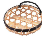
⑬竹 青六ツ目 カズラ付 珍味入れ