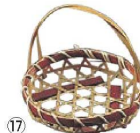
竹つる付珍味入れ