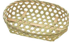
②竹 小判目ざる (10枚入)