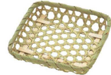
③竹 角目ざる (10枚入)