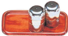
⑮木製カスタートレー