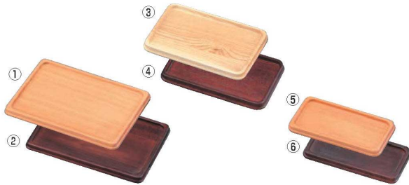
木製 カスタートレー