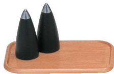
⑬木製カスタートレー