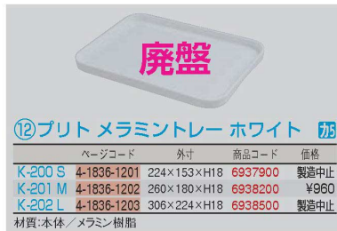
⑫プリトメラミントレー ホワイト