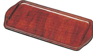
③木製 セット用トレー