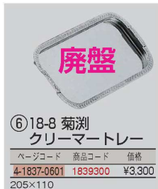
⑥18-8 菊淵 クリーマートレー