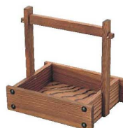
⑫焼杉 手付 カスター大 切