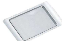
⑦H 18-8 角トレイ