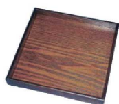
⑭木製 角皿 宴