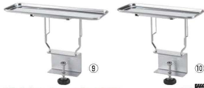
18-8 カスタースタンド II