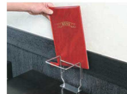
メニューホルダー付