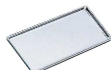
⑧NS 18-0 カスタートレー