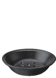
⑧ ストープ ココット ラウンド 22cm専用 セラミック スチーマー バスケット

⚠️ 直径10~14cmなどの小さい鍋は、電磁調理器にかららない場合もございます。