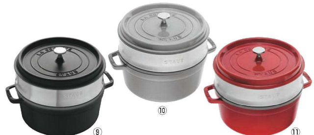
ストープ ピコ・ココット スチーマーセット 26cm