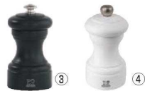
③ペパーミル ビストロ ブラック

φ52×H100 材質:本体/木製(ブナ材) ギア部/ペーパー(鉄) ソルト(ステンレス) ●アンティーク加工を加えたヴィンテージのような雰囲気に仕上げられています。