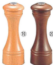
ソルトシェーカー ロティスリー