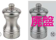
⑨ビストロ ステンレス ペパーミル