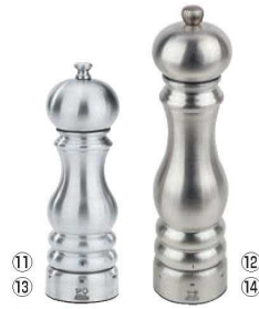
ペパーミル パリ ユーセレクト ステンレス

φ52×H100 材質:本体/ステンレス18-8、ABS樹脂 シャフト/ステンレス ※ステンレスホビーなので、すぐに汚れを拭き取れます。