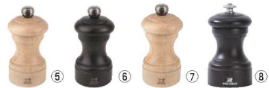
ペパーミル ビストロ

φ52×H100 材質:本体/木製(ブナ材) グラインダー部/ステンレス ●食卓で使用できる人気で便利なサイズです。