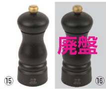
⑮ペパーミル クレモン チョコ