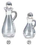
⑮ガラス 手付 ドレッシング