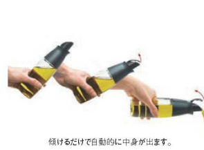
⑯オイル&ビネガーボトル