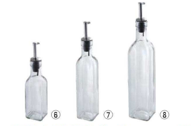
カプリ オイル&ビネガージャー