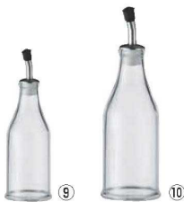
オイルビネガーボトル