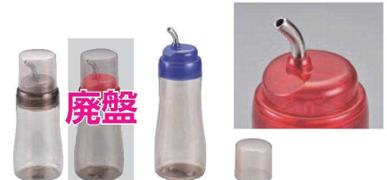
ブルーヘルシーオイルボトル