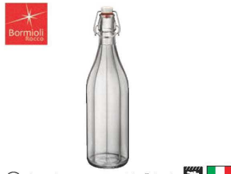
⑤オックスフォードボトル