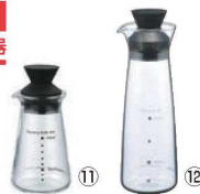
⑪イワキ 耐熱ガラス ドレッシングボトル ミニ