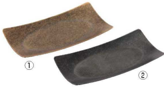
18-8 角型トレイ 71