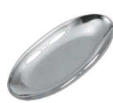
⑩MA 18-0 楕円 おしぼり入れ 71