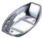
⑨MA 18-8 舟型 おしぼり入れ 72