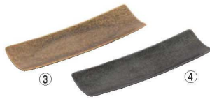
18-8 角型スリムトレイ 71