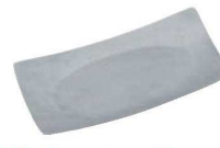
⑲ヴァンテージ 18-8 角型 おしぼり入れ 74