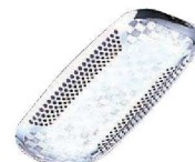
⑪シルバー おしぼり入れ