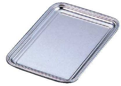
⑦UK 18-8 B 洗いおしぼり入れ