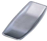
⑧18-8 ナイス おしぼり入れ