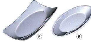
UK 18-8 おしぼり入れ