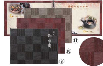
シンビ メニューブック LS-113 ㊦