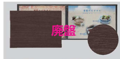
⑭シンビ メニューブック LS-13 ㊦