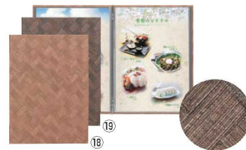
シンビ メニューブック LS-707 ㊦