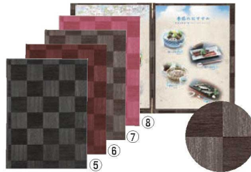
シンビ メニューブック LS-112 ㊦