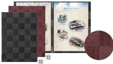
シンビ メニューブック LS-115 ㊦