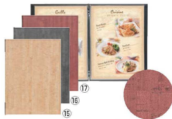
シンビ コルク調メニューブック CORK-301 ㊦