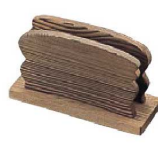
⑥シンビ メニューブックスタンド 切