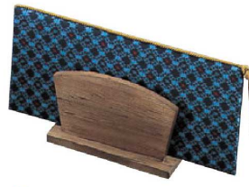
⑦シンビ メニューブックスタンド 切