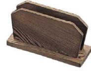
⑧シンビ メニューブックスタンド 切