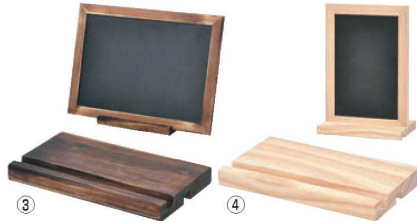
ナチュラルPOPボード専用スタンド 74

材質:木製 ●チョーク・マーカー兼用POPボード、マグネットも使用可能 ●両面タイプ