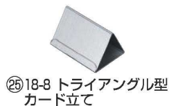
⑳18-8 トライアングル型 カード立て