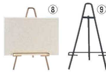
えいむ ミニイーゼル メニュースタンド MS-1 71

外寸:110×40×H276 付属品:替えゴム ●ナチュラルな存在感が特徴のスタンド ●お持ちのパーティションと組み合わせることでスッキリした仕切になります。 ●挟み幅5mm