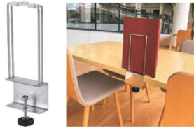
⑦TS パーティションスタンド 71