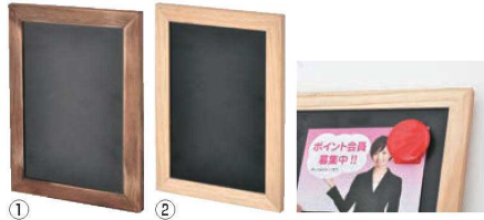
ナチュラルPOPボード 73