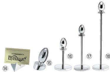
ハイパーラックス テーブルカードスタンド 75

材質:本体/鋼材(クロームメッキ) カバー/ビニール ●POP、カタログ、本、スマホ、タブレット端末などのスタンドに最適 ●原稿1枚から開いた本、CDなど奥行が調整できるから便利です。