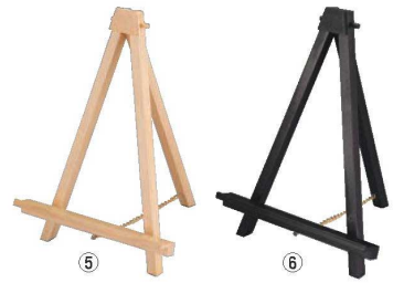
ミニカラーイーゼル 59528 71

外寸:150×90×H15 ●片面に垂直用、もう片面に斜め用の溝があり、どちらにもご使用できます。 ●①・②もご使用ください。