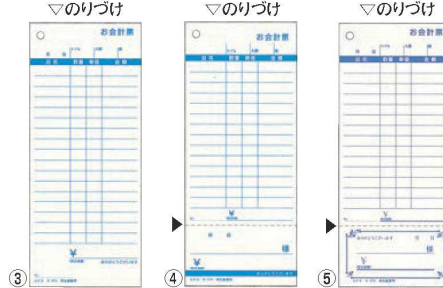
お会計票 (100枚つづり・5冊入)