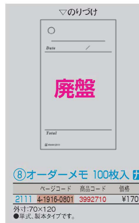
⑧ オーダーメモ 100枚入