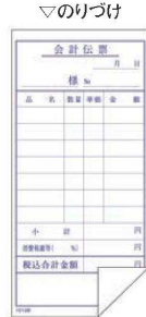
⑦ 単式会計伝票 (100枚つづり・10冊入)