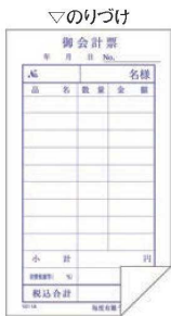
⑥ 単式会計伝票 (100枚つづり・10冊入)