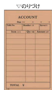
⑨ 単式 会計伝票 (100枚つづり・10冊入)