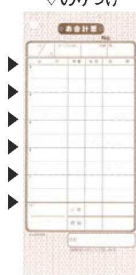
⑧シンビ お会計伝票 洋風 2枚複写 切