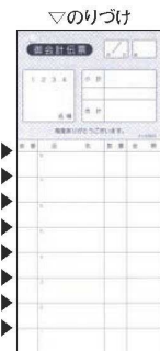
⑩シンビ お会計伝票 2枚複写 切