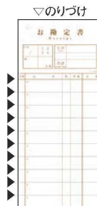
⑫シンビ お会計伝票 和風 2枚複写 切