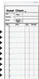
⑬シンビ お会計伝票 英文 2枚複写 175×80 切