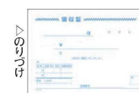
⑥ 軽減税率対応領収書 1P (100枚つづり・5冊入)