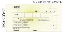
⑤ 領収証 複写タイプ 2枚複写 (50組)