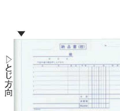
⑬ 納品書 複写 消費税対応 3枚複写 (50組・10冊入)