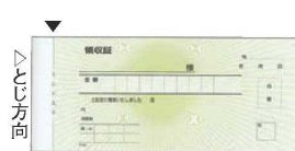
⑨ 領収証 2枚複写 紙幣判 (50組・20冊入)