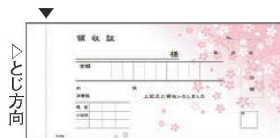
⑧ 領収証 2枚複写 小切手判 (50組・5冊入)