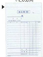
⑭ 納品書 複写 消費税対応 3枚複写 (50組・10冊入)