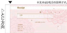
④ デザイン領収証 レース ピンク 2枚複写 (40組) 77