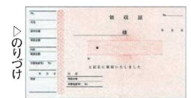
⑩ 領収証 A6 ヨコ型 ヨコ書き 二色刷り 単式