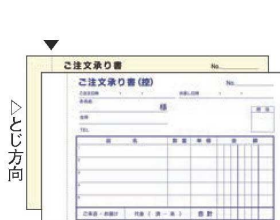
⑫ ご注文承り書 2枚複写 (50組・5冊入)