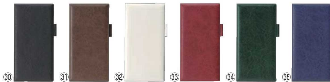
えいむ ペン差し付きロング伝票ホルダー (ニツ折り) 79

外寸:125×245 材質:ビニール ●伝票を折りお客様のおもてなしに最高です。