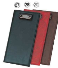
シンピ 伝票クリップ (ニツ折り) AC-7N 79