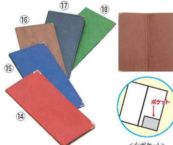
えいむ ラバー 伝票ホルダー (ニツ折り) BH-4 76