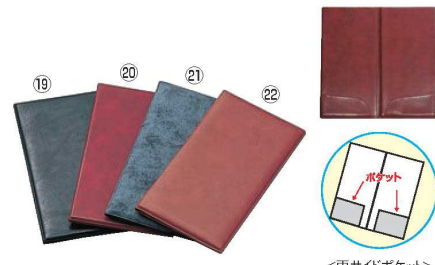
えいむ ソフトビニール 伝票ホルダー (ニツ折り) BH-5 77