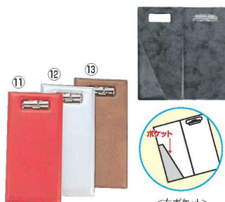
えいむ ビニール 伝票ホルダー (ニツ折り) BH-101 75