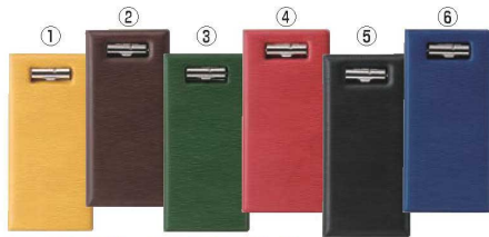
えいむ グループ 伝票ホルダー (ニツ折り) BH-110 73