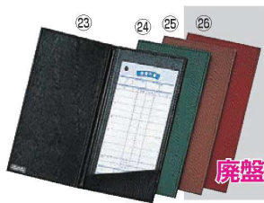
シンピ 伝票ホルダー (ニツ折り) MS-204 78