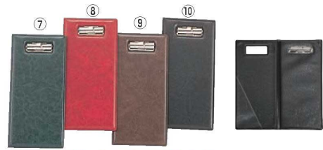
えいむ レザータッチ 伝票ホルダー (ニツ折り) BH-102 74