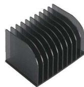
⑬えいむ メニューブック & バイnderスタンド 10列