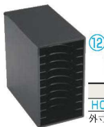
⑫えいむ 伝票バイnderボックス 10段