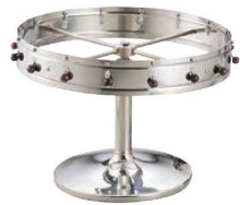
①EBM オーダークリッパー 据置用