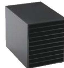
⑰アクリル 伝票クリップケース 10段