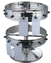
③EBM 据置用 オーダークリッパー 2段式