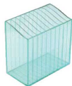
⑭えいむ 伝票バイnderボックス 10段