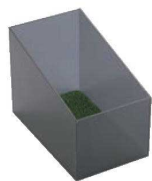
⑪えいむ 伝票バイnderボックス フリー