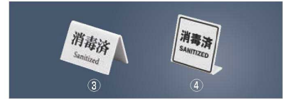
ミニミニサイン 消毒済