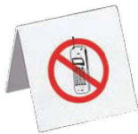
⑤えいむ テーブルサイン 携帯電話禁止 ホワイト