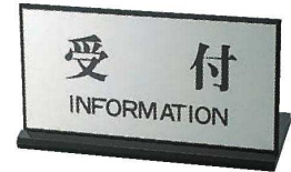
⑦案内プレート受付