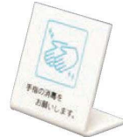
②卓上サイン 手指の消毒を