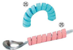
くるくるグリップ HS-N15