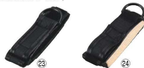
曲げ曲げハンドル用差し込みバンド