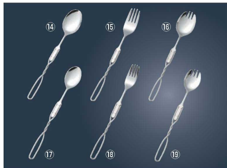
曲げ曲げハンドル