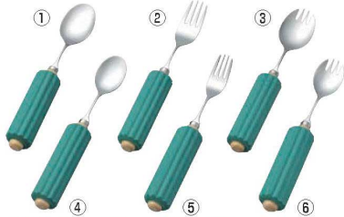
木製丸ハンドル・スポンジ付