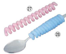
くるくるシリコングリップ HS-N23

φ20×120 重さ:10g 材質:EPDMスポンジ(耐熱温度-20℃~110℃) ●スプーン・フォーク・歯ブラシ等の柄にぐるぐる巻いてしっかりグリップ ※スプーンは別売です。