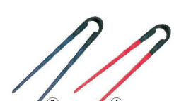
プチエイド 箸 HS-H

材質:ポリスチレン、ポリアセタール樹脂 全長:230 重さ:25g ●クリップは着脱式なので、箸を抜いて洗うことができます。1膳25gの軽さで、どちらの手でも使用可能です。