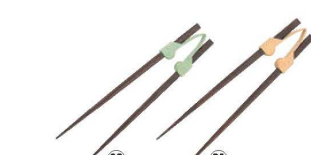
らくらくお箸 (クリップタイプ)

材質:積層強化木 ●左右どちらの手でどんなふうにも握っても箸の先が自然にキチッと合います。