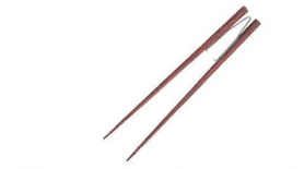
①らくらくお箸すべり止め付 (ピンセットタイプ)