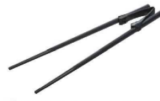
②楽々箸 クリップタイプ 23cm

材質:梧桐、ポリアセタール樹脂 全長:225 重さ:24g ●クリップは着脱式なので、箸を抜いて洗うことができます。 1膳24gの軽さで、どちらの手でも使用可能です。