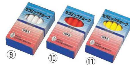
セラミックチョーク Q-CT (10本入)