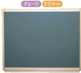
④ウッターチョークグリーン(壁掛黒板)