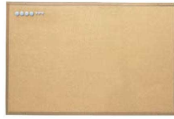
②マグピンコルクボード