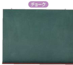
⑤壁掛用木製ボード