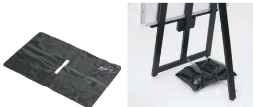
⑦ 重し水袋 (フロントイーゼル用) FB