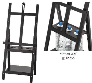
⑪ 転倒防止イーゼル FB 別梱包