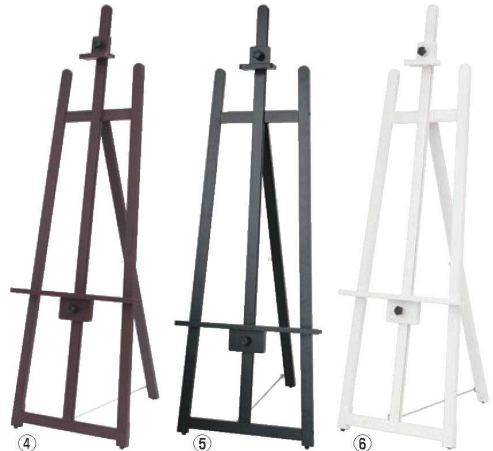
フロントイーゼル T-160 43000 FA