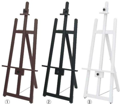
フロントイーゼル T-140 42998 FA