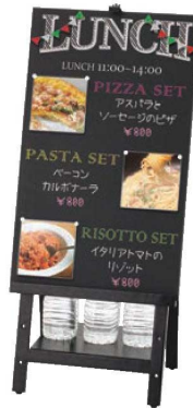
⑫ ELPA LEDクリップライト 屋外用 FA

重量:2.7kg ●2本のペットボトルが3本置けるイーゼル ●ボード受けはお好みの高さで固定できます。 ※おもひは市販の2本ペットボトルをご使用ください。