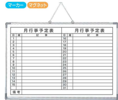
⑥アルミ枠ホワイトボード (月行事予定表) トレー付 X1

●マグネットシートのホワイトボードですから冷蔵庫のドアや金属部へ簡単に付けられメモ書き、予定表などに使えるので大変便利です。 ●マーカーはイレーサー付でマグネット式ですから場所を取りません。