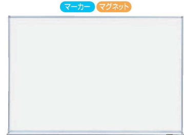
③コクヨ ホワイトボード (無地) X1