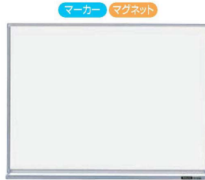
②コクヨ ホワイトボード (無地) X1