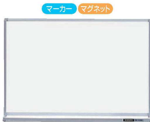
④コクヨ ホワイトボード (無地) X2