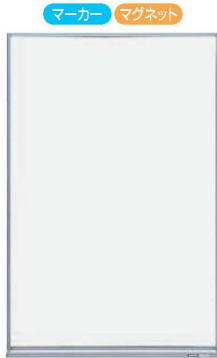
①コクヨ ホワイトボード (無地) X1