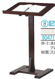
⑧記帳スタンド古代色 画A