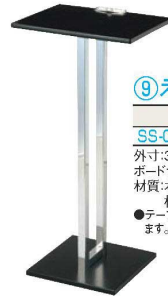
⑨えいむ テーブル型記名台 画A