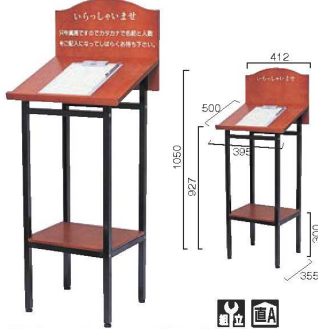
①ウエーティングスタンド 画A