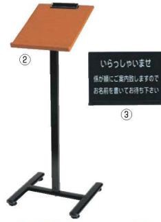
②えいむ 記名台 画A