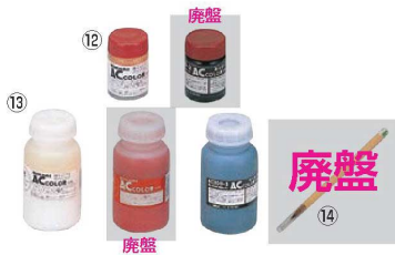
タッセル用ACカラー 画B