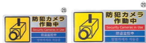
多国語防犯対策ステッカー