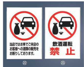
飲酒運転禁止 プレート