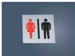
⑧金属サイン 男女マーク