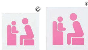
ベビーチェアマーク