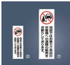
飲酒運転禁止 プレート