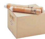
⑲かがり火 松明専用 ろうそく (20本入)