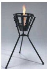
⑱演出用かがり火 松明 小型

防雨機能のついた屋内外 問わずに使える電気照明式 と風が吹いても消えにくい専 用ろうそく式の2タイプ。 料亭・旅館等の玄関や中 庭・露天風呂・冠婚葬祭・各 種イベント等に幅広い演出 が可能です。