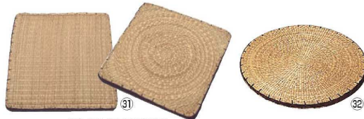
※表裏で編み方が異なります。

サイズ:470×470×H40 カバーサイズ:500×500 ファスナー加工 カバー材質:綿100% 中素材:カテキウレタン