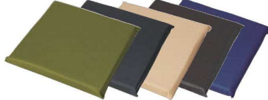
⑤⑭ ぐいす ⑥⑮ グレー ⑦⑯ ベージュ ⑧⑰ 黒 ⑨⑱ 紺

サイズ:470×470×H40 カバーサイズ:500×500 ファスナー加工 カバー材質:PVCレザー100% 中素材:カテキウレタン ●中身は茶カテキウレタンです。消臭抗菌作用があります。