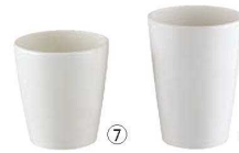
メラミン タンブラー HG ホワイト ㉔