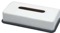
⑨ティッシュボックス (浅型) ㉔