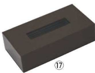
カラーティッシュボックス ㉔