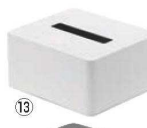
ハーフティッシュボックス タワー ㉔