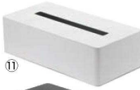
ティッシュボックス タワー ㉔