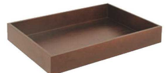
⑭ ケヤキ合板 衣装盆 加