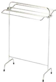
④ タオル掛け S-1 加