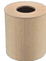
⑥ ホワイトオーク ダストボックス 蓋付 加