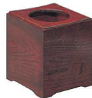
⑧ 和風 ケヤキスリ 屑入 加