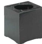
⑨ 和風 ケヤキ黒 屑入 加