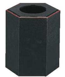
⑩ ウレタン 六角千筋 屑入 加