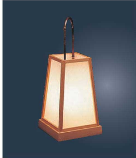
① 路地あんどん 錦 加