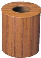
⑦ チーク ダストボックス 蓋付 大 加