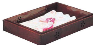
⑬ 木製 衣装盆 ムク スカジ入り ケヤキ色 加