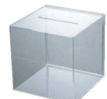
⑭ 応募箱 41434