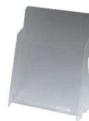
⑦ カタログホルダー A190 (B5判)