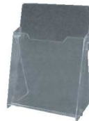
⑥ カタログホルダー A230 (A4判)