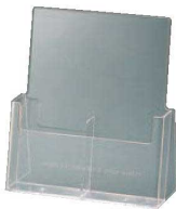
⑨ パンフレットスタンド 2C-112