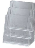
③ カタログホルダー 3C230 (A4判3段)