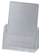
⑤ カタログホルダー C230 (A4判)