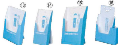
ペーパーリーフスタンド